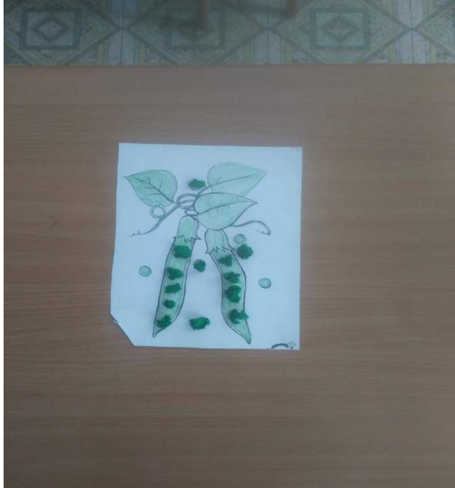
Примеры «отрывной аппликации»