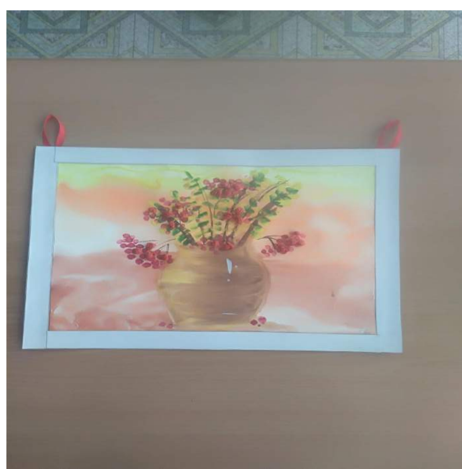
Совместная с родителями работа