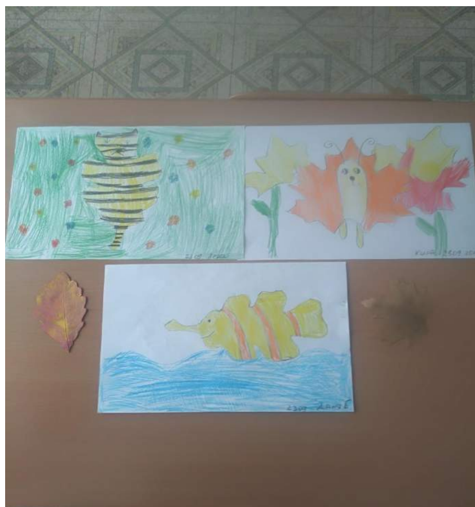
Техника оттиска штампами